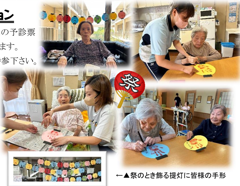
←▲祭のとき飾る提灯に皆様の手形をとり、お名前を書いて頂いてます