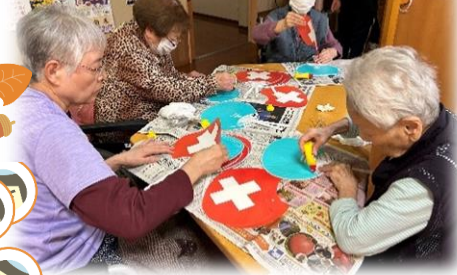
▲▼祭の準備物を作成中 (6・7丁目にて)