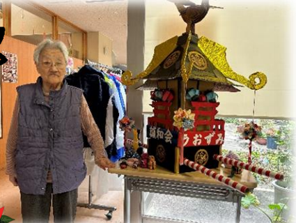
▲ダンボール神輿をバックにパチリ