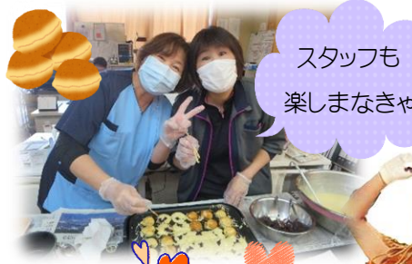
スタッフも 楽しみなきゃ