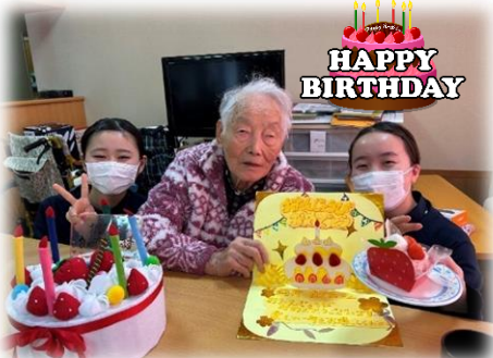
▲▼ご覧ください。バースデーカード