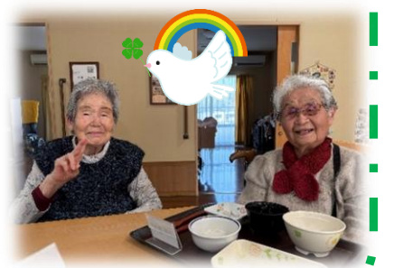
▲右が筆者。ひとつ年上の盟友と