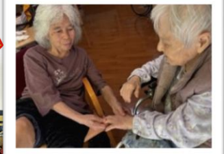
▲手相を見る?(4/17) ←先月号でとりあげた君子蘭が開花!(4/13)