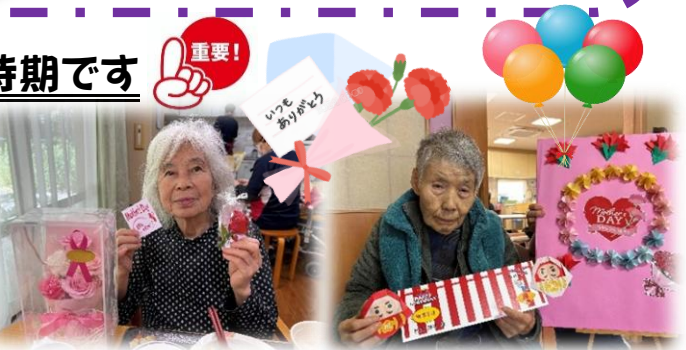
▲▼母の日に、花をケーキを！バースデーを迎えた方も(5/11)